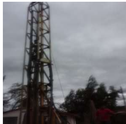
Perforación del Pozo