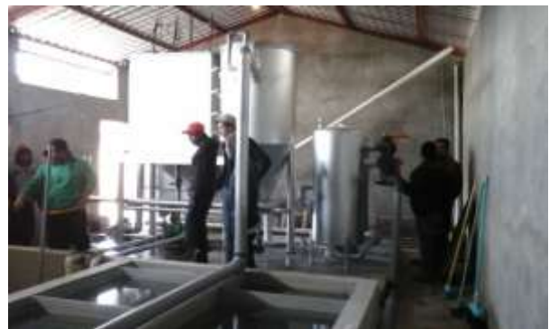
Planta de Tratamiento