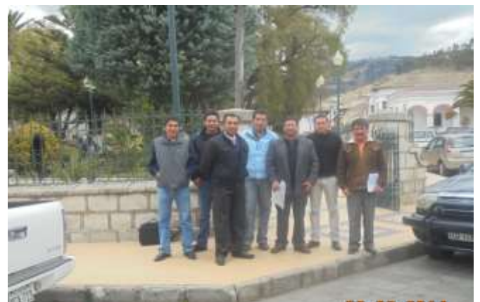
Firma de Convenio para el Agua de Consumo