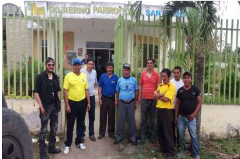
Fig. San Pedro de Suma