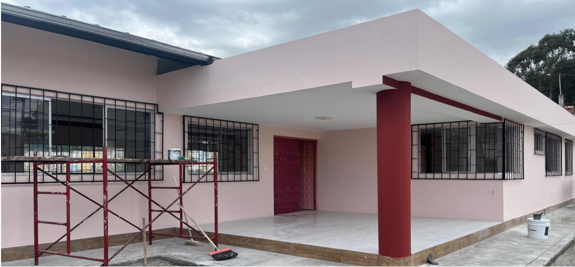
Adecantamiento de los baños de la Cancha de la Comuna El Tejar de la Parroquia La Victoria