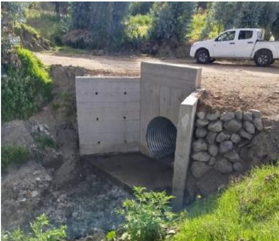
Paso 2: lado derecho