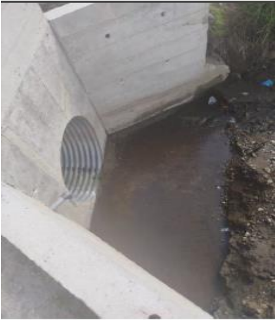
Paso 1: lado derecho

Construcción de 2 pasos de agua en el Barrio Santo domingo, Parroquia La Victoria, Cantón Pujilí, Provincia de Cotopaxi