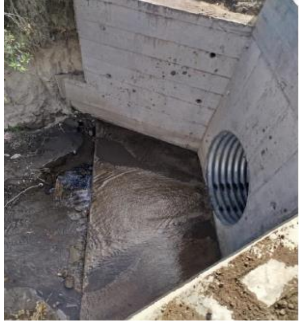
Paso 1: lado izquierdo