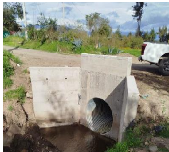
Paso 2: lado izquierdo